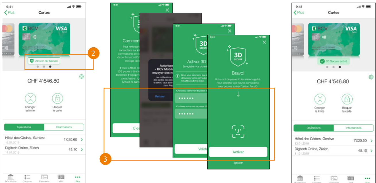
Carte compatible e-commerce