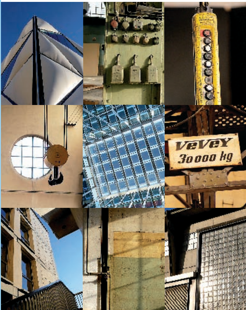
ACMV, Vevey – Le Flon, Lausanne: quand l'ancien se marie au moderne.

Montreux compte un certain potentiel pour la densification de l'habitat, comme le relèvent le Plan directeur communal et le nouveau PGA, mais il demeure conditionné à la recherche de la qualité tant pour l'habitat urbain que pour les espaces publics.